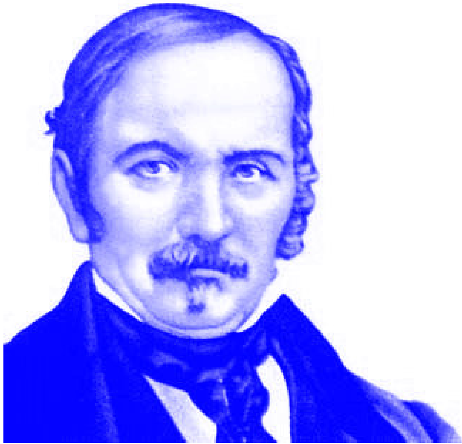
Anexo 3 – Allan Kardec